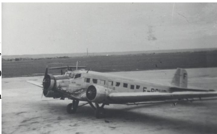
Ju 52, probablement immatriculé F- BCHB Aéro Cargo

Ce dernier sera détruit à l'atterrissage à Vichy-Charmeil.