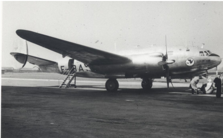
SO 30 P Bretagne, immatriculé F-BAYN Aéro Cargo

Le SO-30 P 'Bretagne', version B-43, n°11, prototype immatriculé F-WAYN, construit à Saint Nazaire en 1948, puis aménagé en version cargo en janvier 1950, immatriculé F-BAYN, est confié à Aéro Cargo pour essais d'endurance.