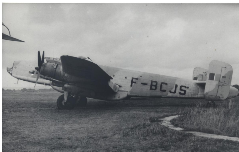
Handley Page Halifax, immatriculé F-BCJS, Aéro Cargo